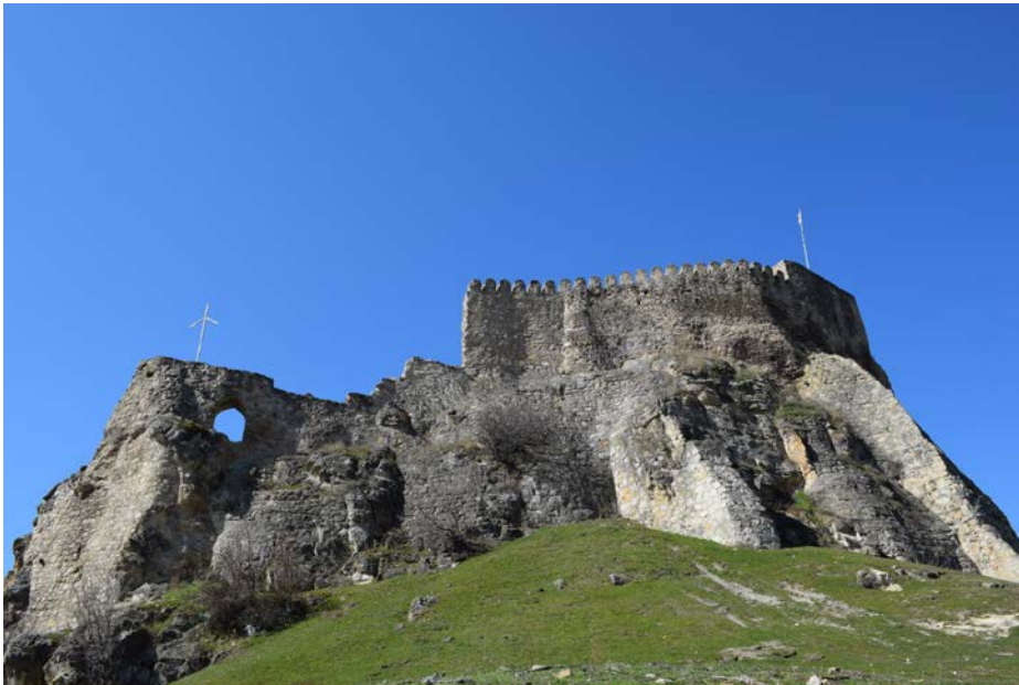
სურ. 1. სურამის ციხე, ხედი დასავლეთისაკენ

იმავე 10 მარტს, გვერდისუბნის ეკლესიის წარწერაზე მუშაობის დასრულების შემდეგ, სურამის ციხეში ავედით და მისი შემორჩენილი ნაგებობები დავათვალიერეთ. განსაკუთრებით საინტერესო აღმოჩნდა წმ. გიორგის ეკლესია, რომელიც ციხის ქვედა ეზოს სამხრეთ-აღმოსავლეთ ნაწილში მდებარეობს (სურ. 1 და სურ. 2).