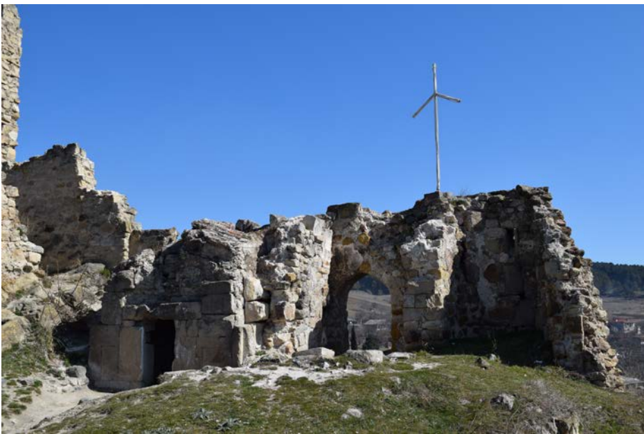
სურ. 2. სურამის ციხის წმ. გიორგის ეკლესია, ხედი ჩრდილო-აღმოსავლეთისაკენ